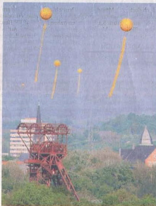
Start um 12 Uhr mittags: Vor dem Aussichtspunkt der Kohlenwäsche auf Zollverein steigen die Ballone auf.

Zehn schwarze Ballone ließ am Samstag auch der Landesverband der „Bergbaugeschädigten steigen“, darunter in Dorsten, Bergkamen, Voerde und Rheinberg. Das solle „keine Gegenveranstaltung sein“, so ein Sprecher, bei aller Sentimentalität gelte es aber, auch an die Schäden durch Bergbau zu erinnern. Subventionen in eine sterbende Industrie zu stecken, sei unsinnig.